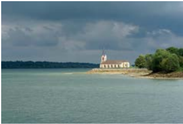
Lac du Der - Eglise de Champaubert