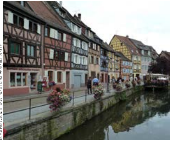
Colmar Petite Venise