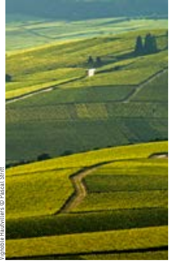
Vignoble Hautvillers