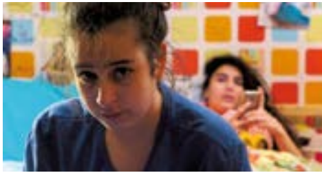
DES BAILS DE RÊVE de Antoine Desrosières Long métrage produit par Les Films de l'autre cougar