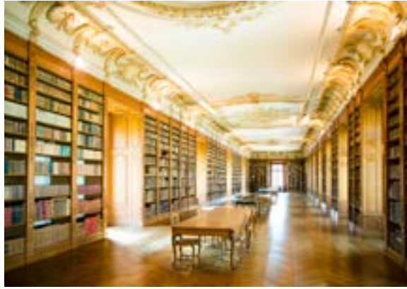
Bibliothèque St Michel