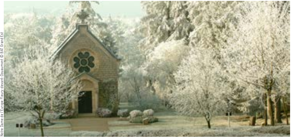
Noire Dame de l'Europe Fleury-devant-Douaumont