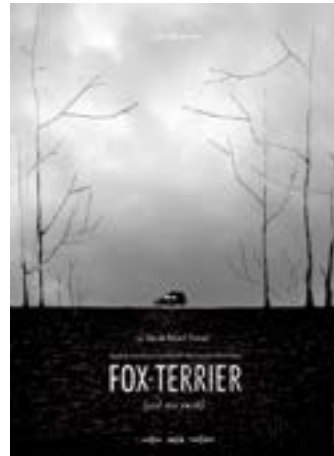
FOX-TERRIER de Hubert Charuel Court métrage produit par Les Films Velvet