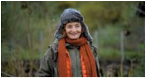
CAPITAINE MARLEAU de Josée Dayan Série coproduite par France 3 et Passion Films (4x90')