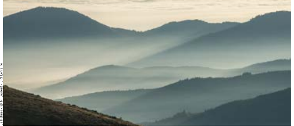
Le Hainack