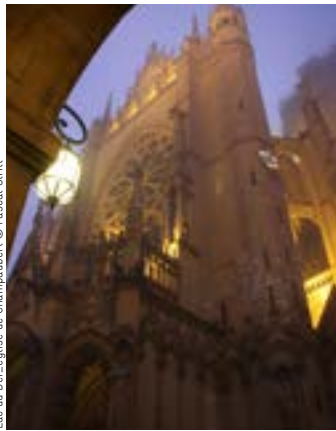
Cathédrale de Metz