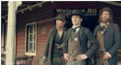
TEMPLETON de Stephen Cafiero Série coproduite par Skits Productions et Telfrance © Skits & Telfrance