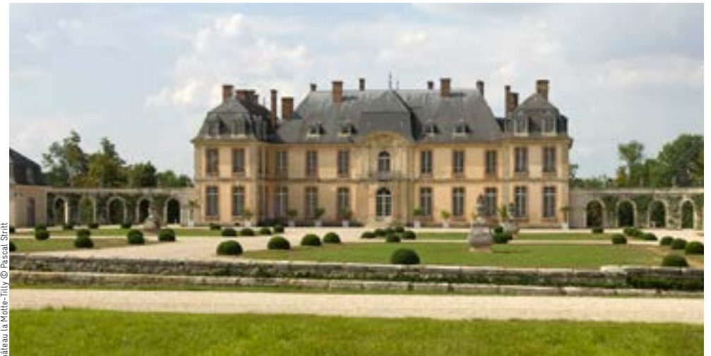
Château la Motte-Tilly