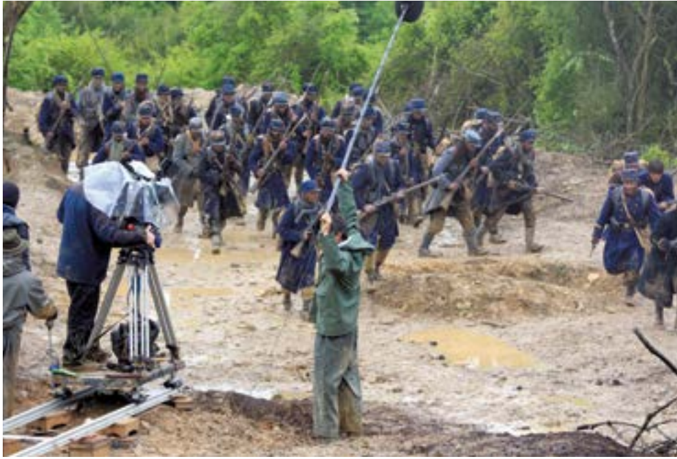
Œux de 14