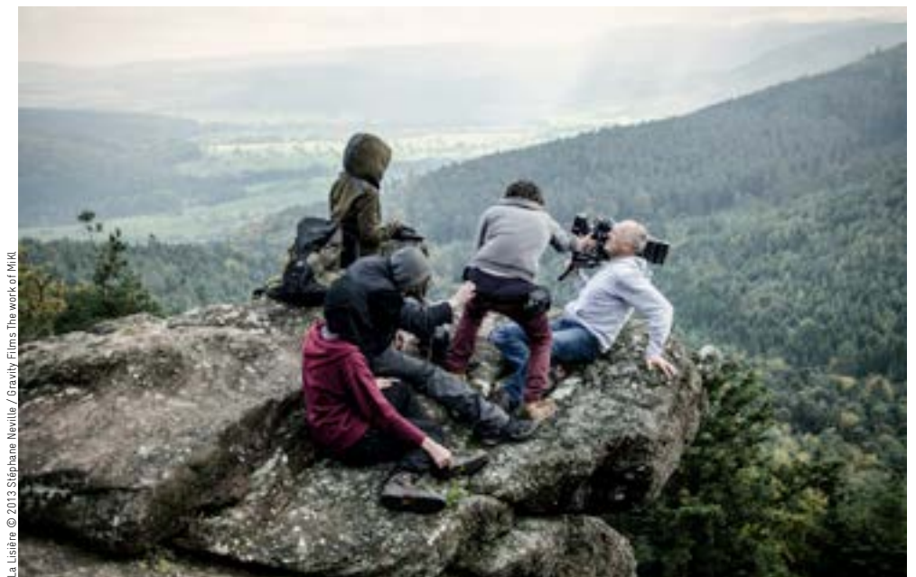
La Lisière The work of MIKI