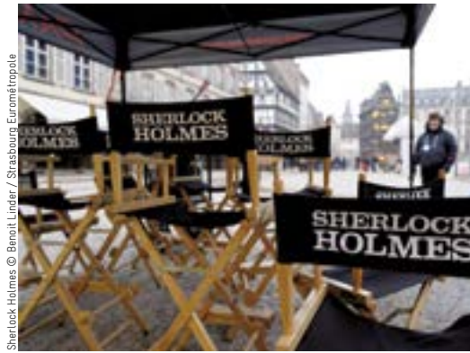
Sherlock Holmes