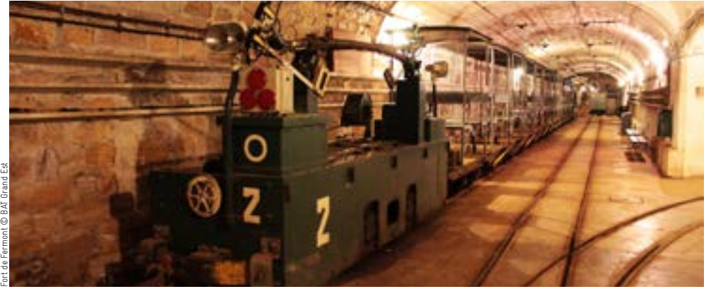
Fort de Fermelet