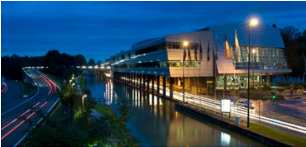
Centre Congrès Reims