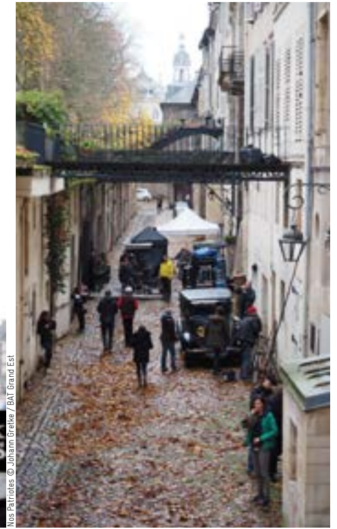
Nos Patrimoines